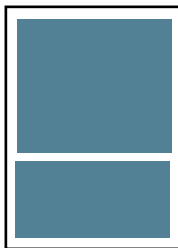
2-spaltet: b: 158 mm